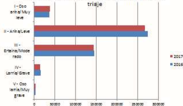
Larrialdietan banaketa, triajearen lehentasunaren arabera / Distribución de urgencias según prioridad del triaje