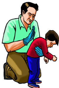
Mayor de 1 año: Golpes interescapulares