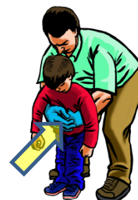
Mayor de 1 año: Maniobra de Heimlich