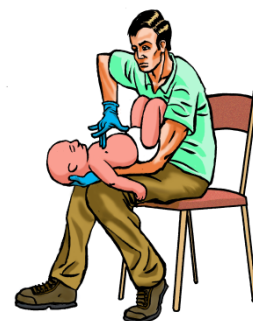
Menor de 1 año: Golpes torácicos