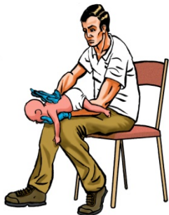
Menor de 1 año: Golpes interescapulares