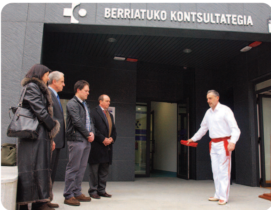
LEA-ARTIBAI, MUTRIKU ETA BUSTURIALDEKO HITZA