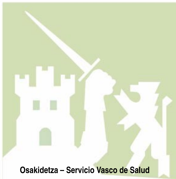
Osakidetza – Servicio Vasco de Salud