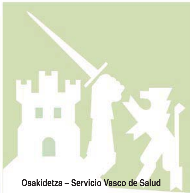
Osakidetza – Servicio Vasco de Salud